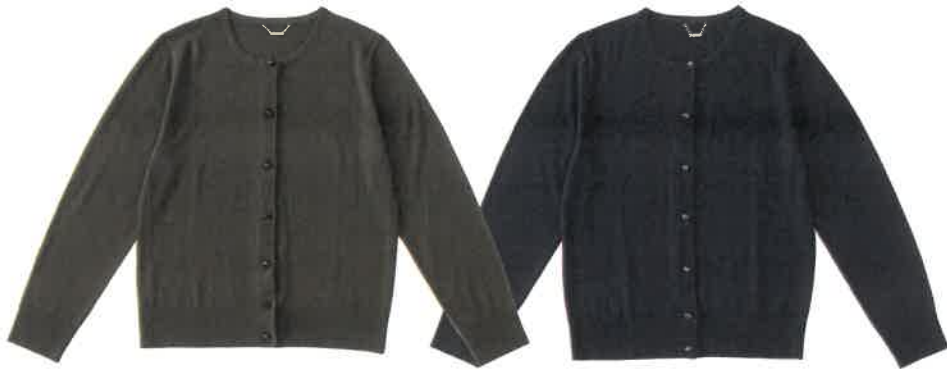
KRGJHW6856 オリーブ×ジェット